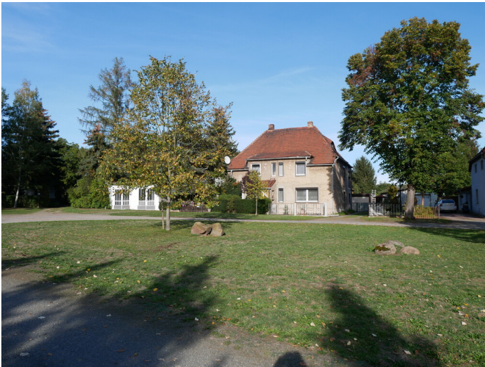
Siedlung Kahla

Schlagwörter: Werkssiedlung Fachsicht(en): Denkmalpflege Gemeinde(n): Plessa Kreis(e): Elbe-Elster Bundesland: Brandenburg