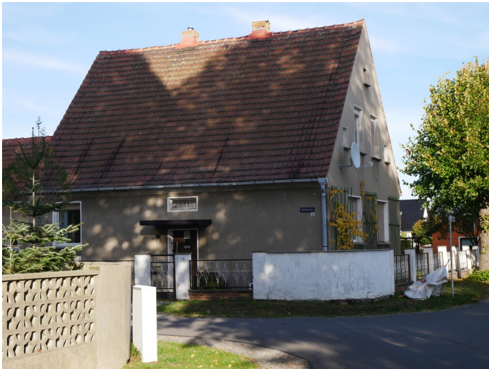
Siedlungshäuser für Grube Agnes