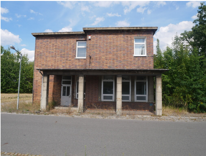
Haupteingang Großkokerei Lauchhammer