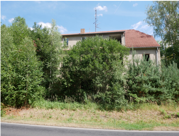
Verwaltung Ferrowerk Mückenberg