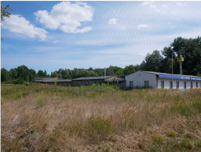
Lehrwerkstatt des BKK Lauchhammer