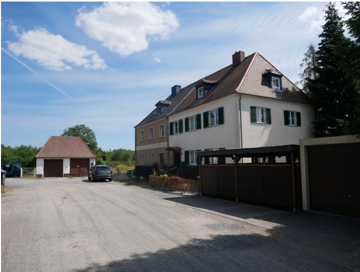
Wohnhäuser leitender Angestellte des Chemowerk