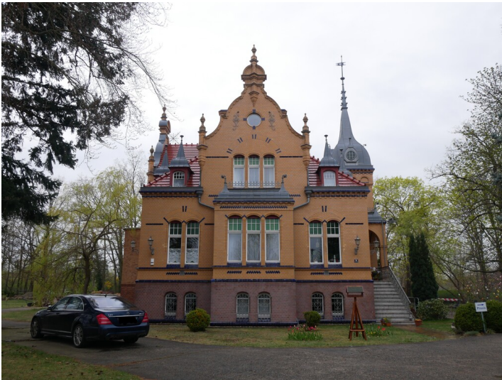
Villa Hubert