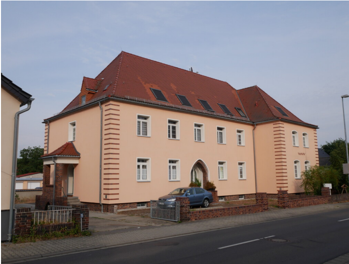
Gemeindehaus/Rathaus Zschornegosda