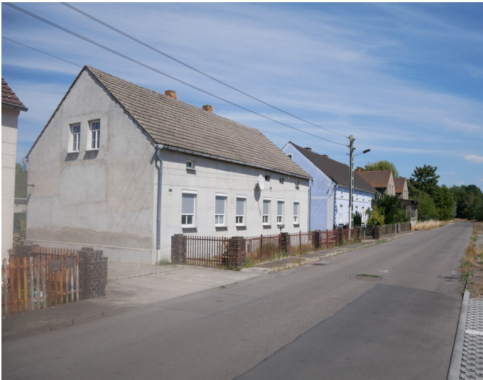
Werksiedlung Ziegelei Werner