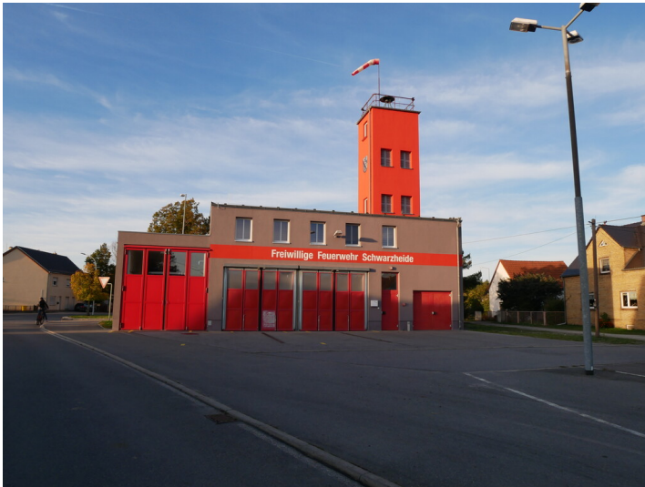
Feuerwehr Schwarzheide Ost