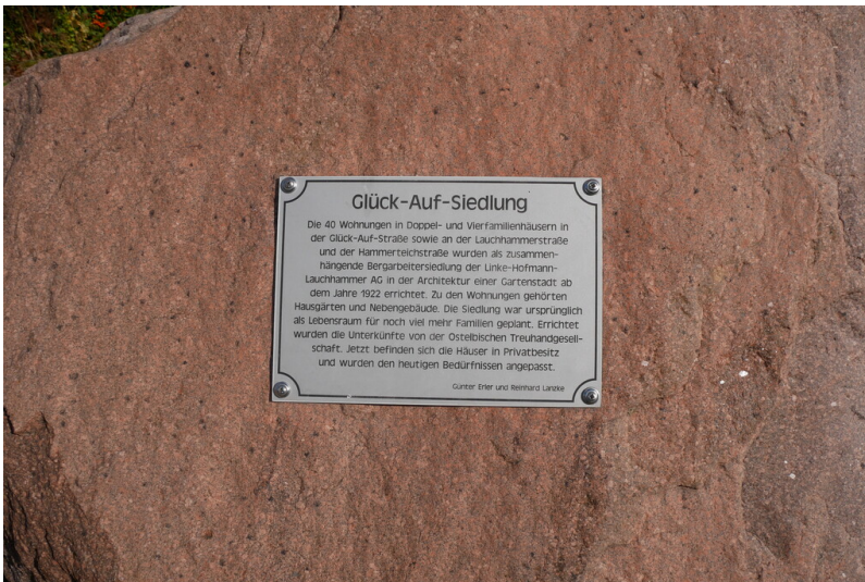
Siedlung Glück-Auf