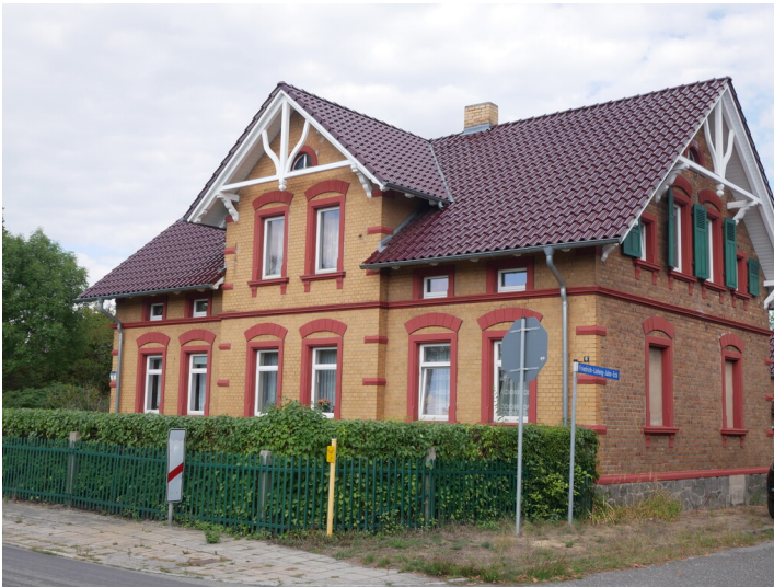
ehem. Siedlung im Areal Schwarzheider Straße, Jahneck, John-Scheer-Straße