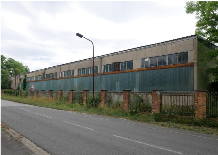
Werkstatt der Brikettfabriken 64/65