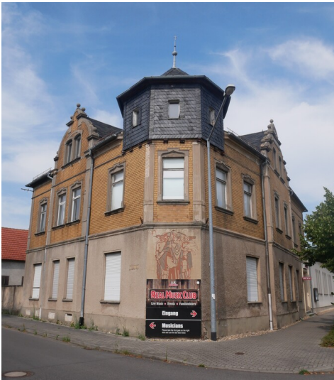
Gasthof Glück Auf