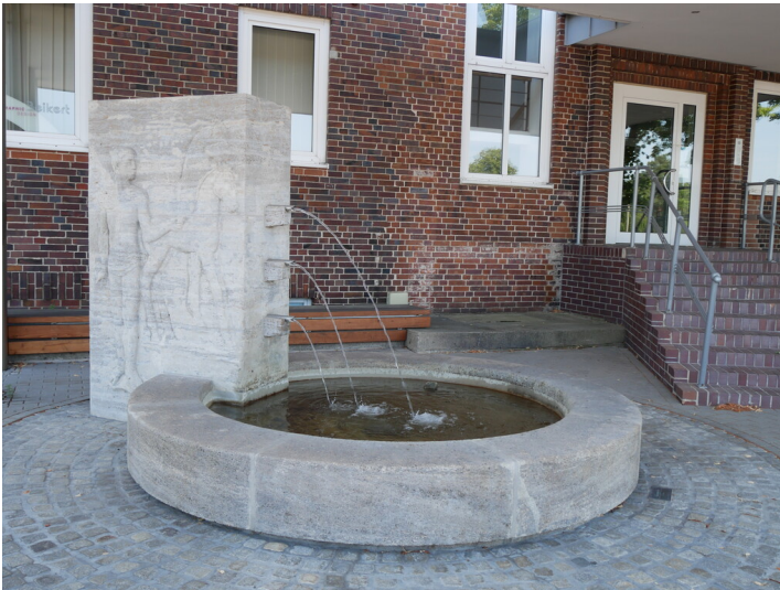
Blumenthal-Brunnen ehemals in der Bereitschaftssiedlung