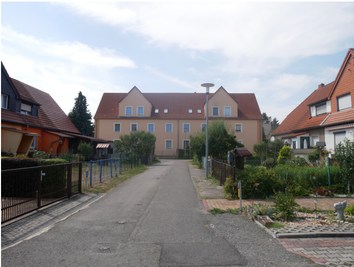
Siedlung Grube Ferdinand in der Glück-Auf-Straße