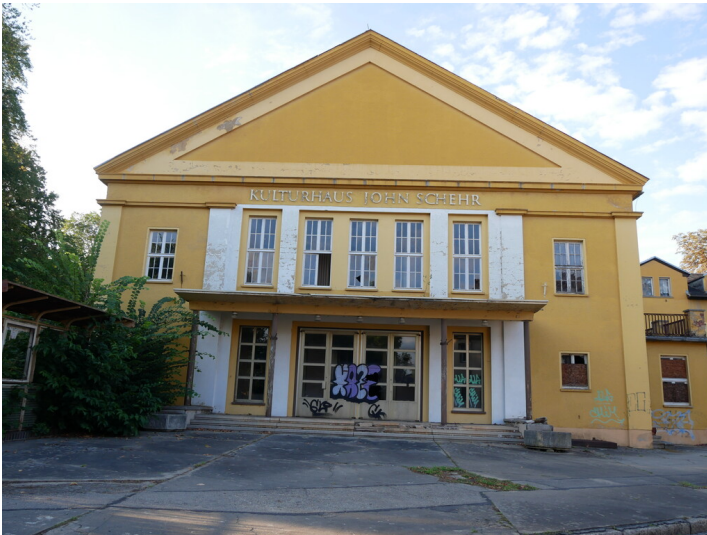
Kulturhaus John Schehr