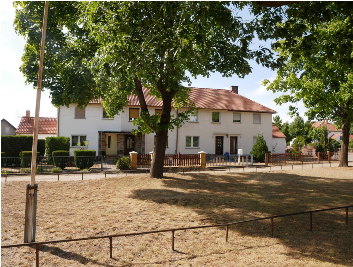
Bergarbeitersiedlung Grube Milly