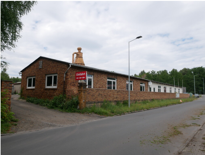
Werkstätten der Brikettfabrik Milly