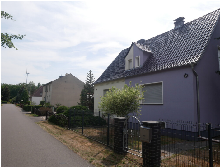
Siedlung Grube Ferdinand