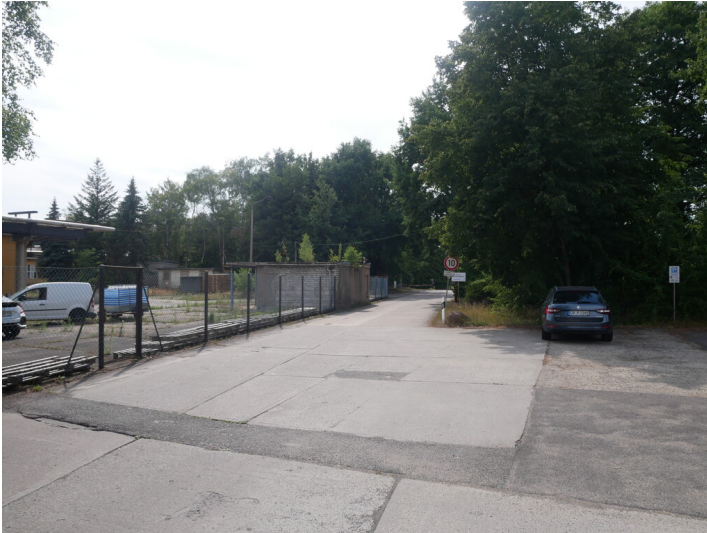
Absiedlungsbereich Wilhelm-Külz-Straße