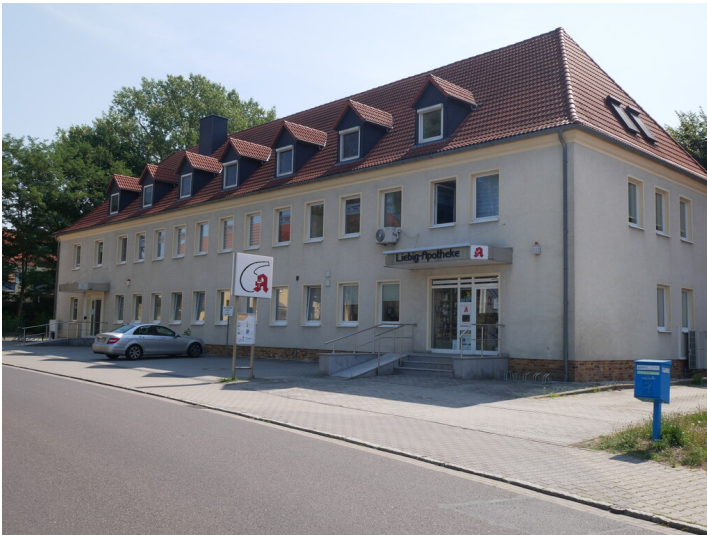
Betriebskindergarten der Brabag