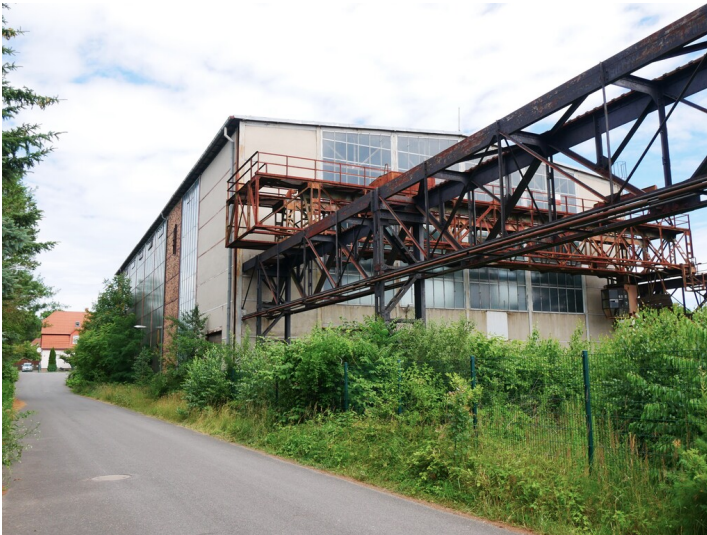
Werkstätten VEB Takraf