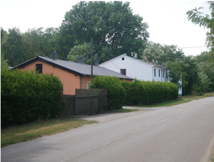
Restgebäude der Brikettfabrik Louise XX/Ferdinand