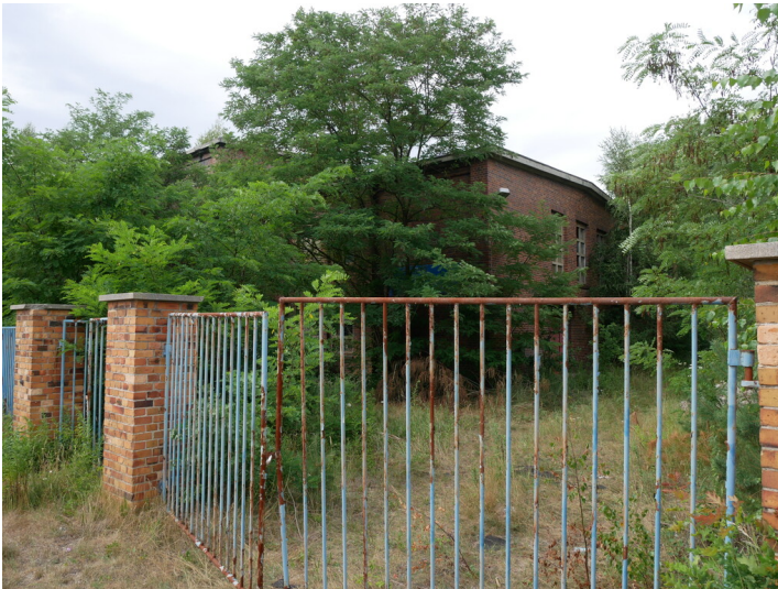
Hauptwerkstatt Mückenberg