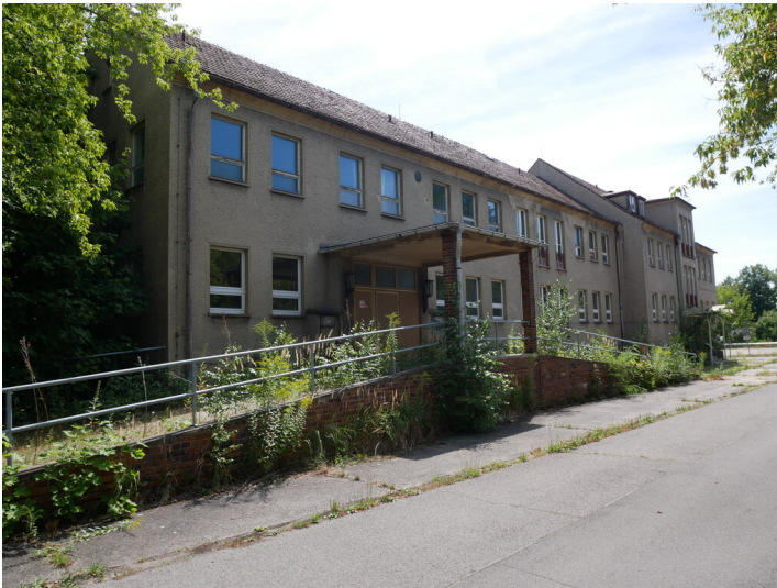
Betriebspoliklinik des BKK Lauchhammer West