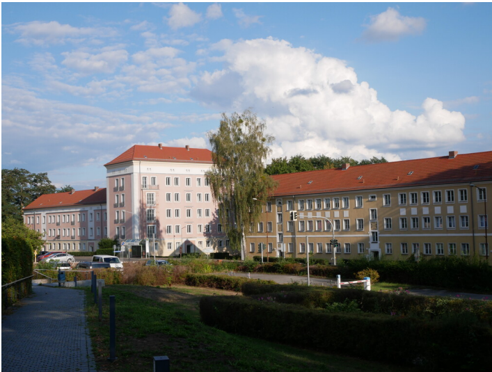
Wohnanlage Friedensstraße