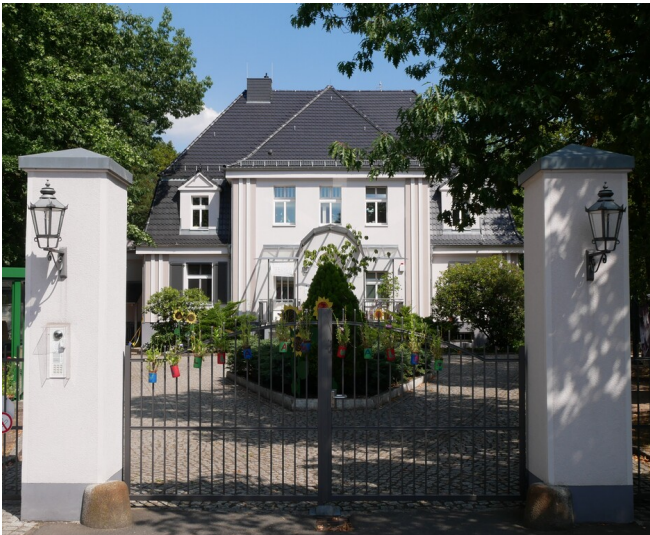
Direktorenvilla Victoria III