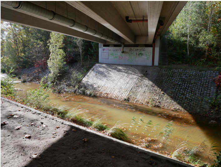
Überleiter zwischen Südsee und Ferdinandsee