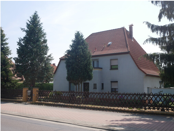
Wohnanlage Hugo-Wolfram-Platz ehemals Bürenhof