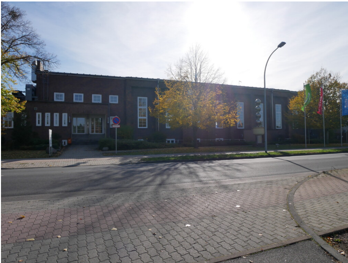
Kulturhaus der BASF