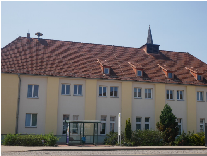
ehem. Gemeindeamt Zschornegosda Prinz-Lichtspiele