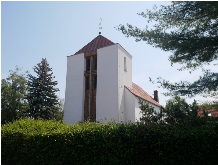
katholische Heilig Kreuz Kirche