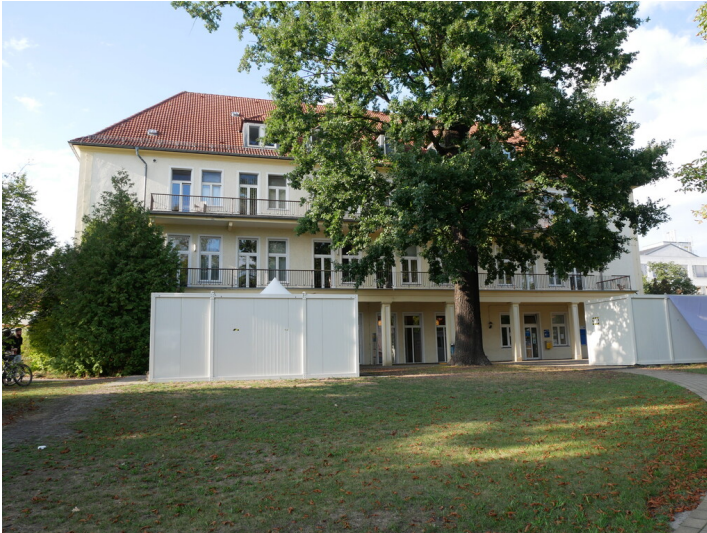
ehem. Bergmannkrankenhaus Lauchhammer Ost