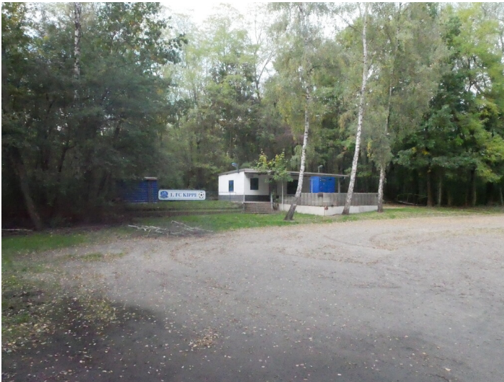
Förderbrückenkippe des Tagebaus Kleinleipisch