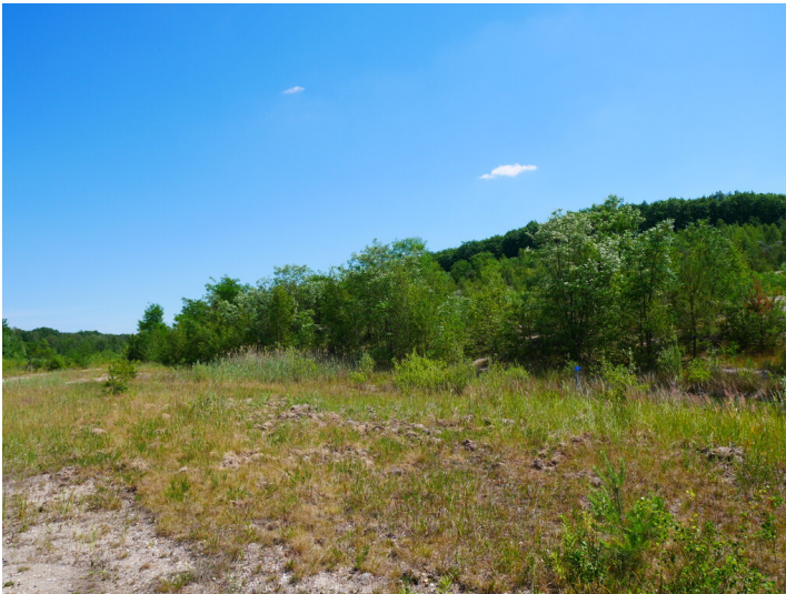
Aufforstung auf der Hochkippe 1008