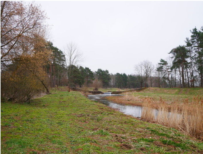
Absturz Kleinkoschen