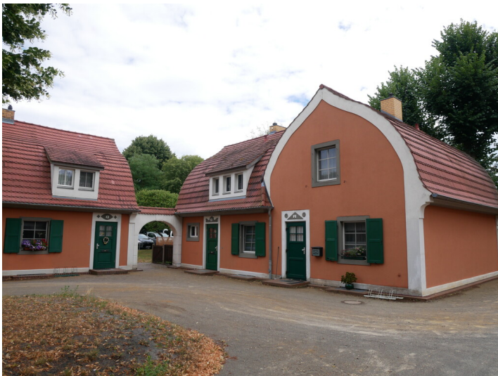
Werksiedlung Grundhof