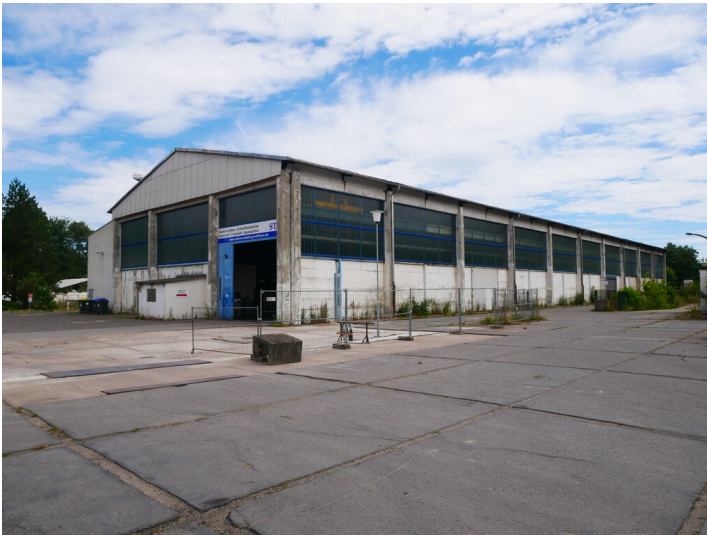
Ziegelei Werner