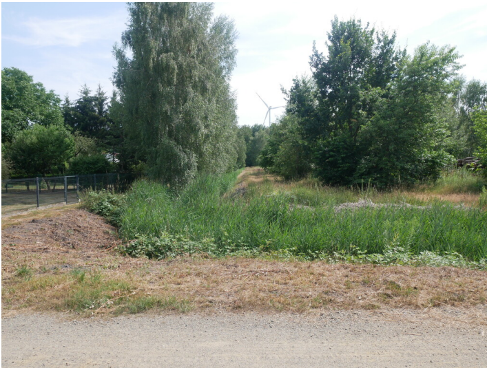
Hammergraben Lauchhammer