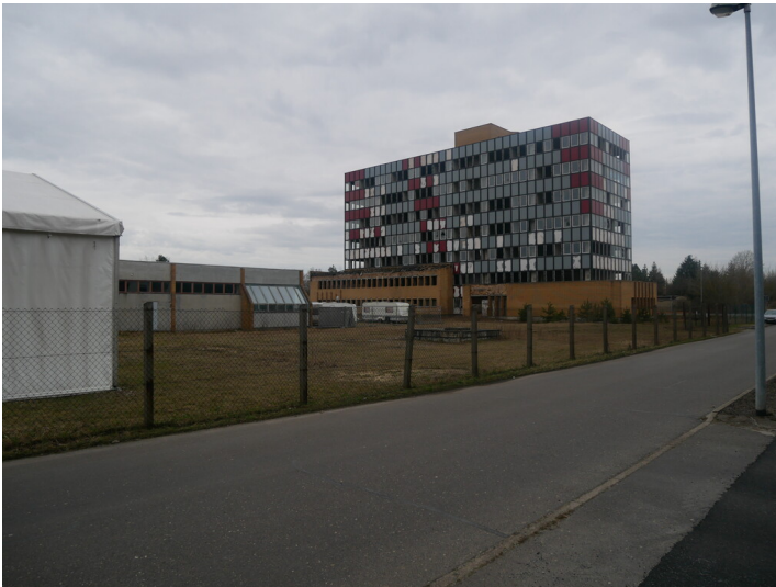
Verwaltung des VEB Niederlausitzer Klinkerwerke Großräschen