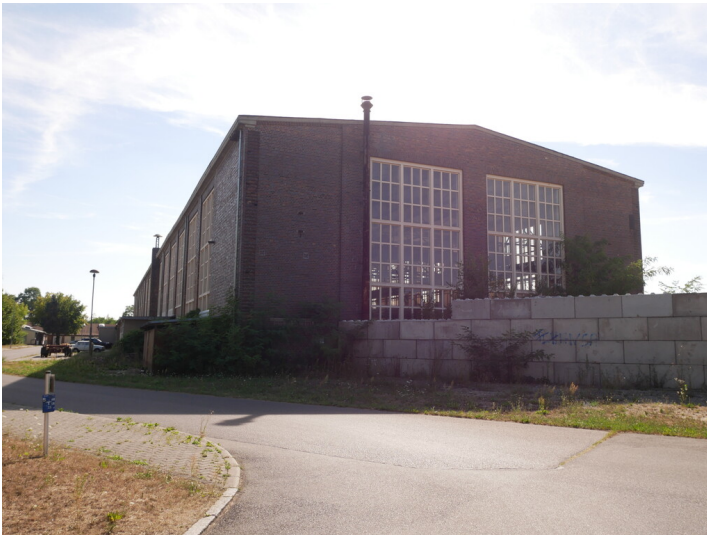
Restgebäude Hauptwerkstatt-Süd und Lehrwerkstatt