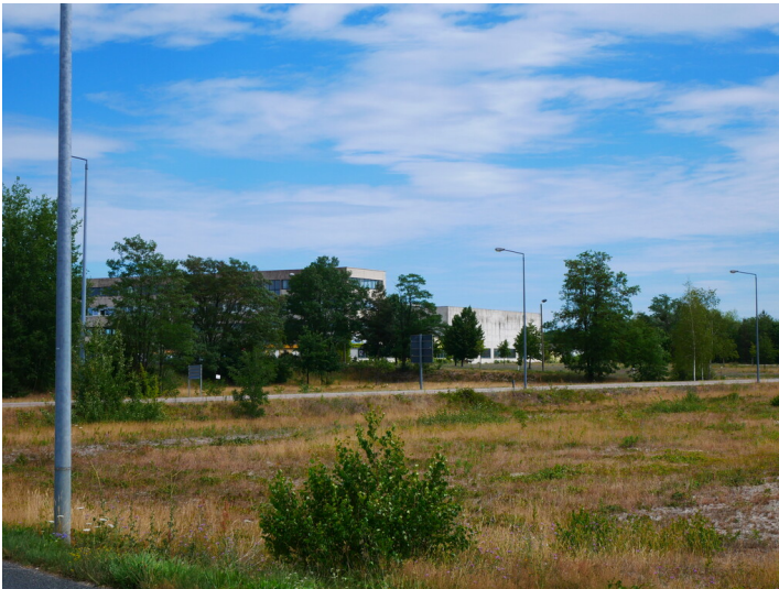
Industriekraftwerk 69 Lauchhammer