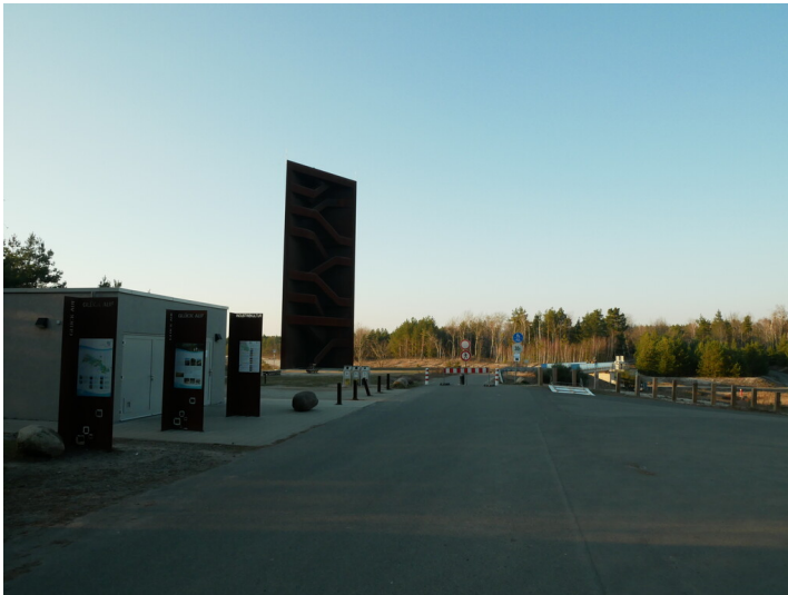
Rostiger Nagel