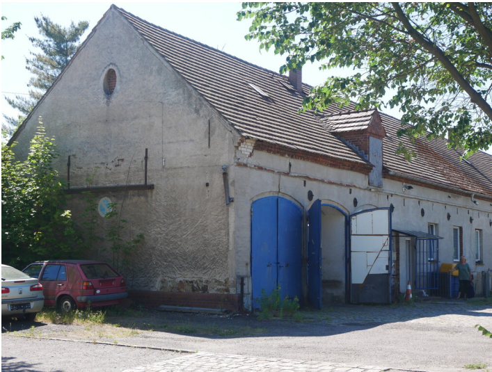
Wirtschaftsgebäude des ehemaligen Gutshofes