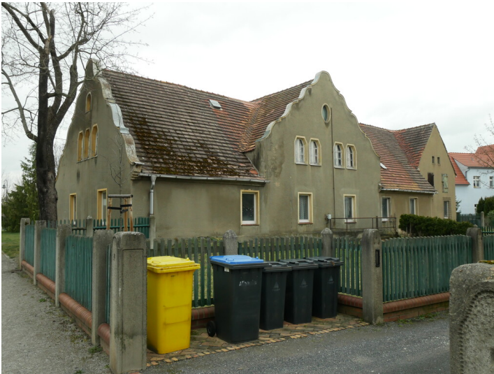
Feldscheune sog. Kutscherhaus