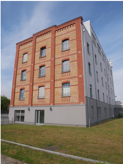
Dampfmühle Senftenberg