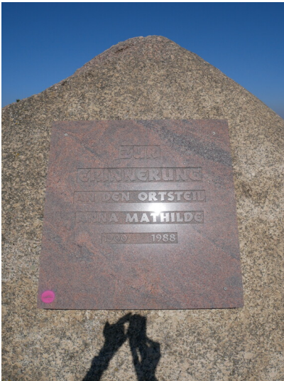
Gedenkstein Anna Mathilde