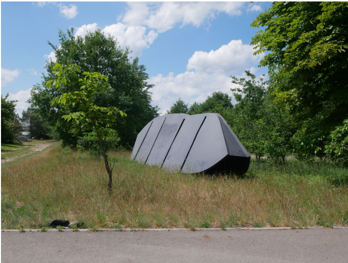
Die Arche