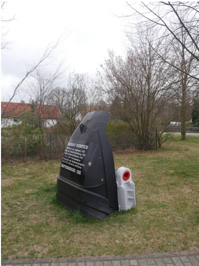
Schaufelstück und Lore